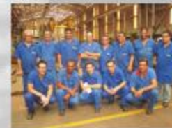
Equipe da Produção de AMV