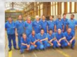
Equipe da Produção de AMV