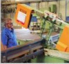
Operação de corte dos trilhos