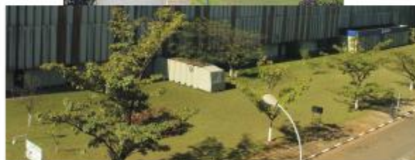
Áreas externas, pintadas e jardinagem refeita