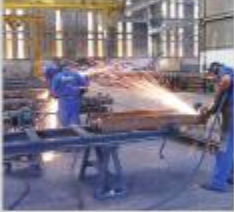
Operação de ajustagem e montagem