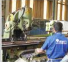
Operação de fresagem nos trilhos