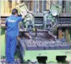
Operação de aplainamento dos trilhos