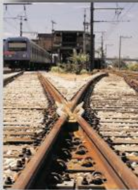
Jacaré nº 8

Nesta Edição, vamos falar um pouco sobre Via Permanente! Para quem não conhece, trata-se de uma via ferroviária por onde trafegam os trens sobre os trilhos e, na via permanente, que é utilizado o AMV (Aparelho de Mudança de Via), onde se faz a mudança de direção dos trens.