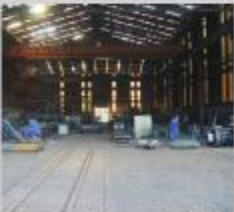
Saída dos AMVs para Expedição