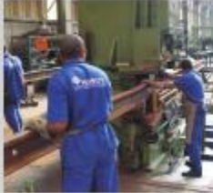
Operação de dobras nos trilhos