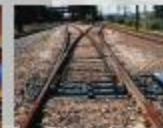
A.M.V. Nº 8 Simétrico