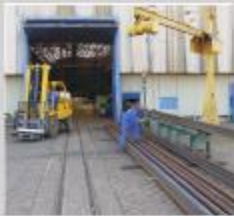
Entrada dos Trilhos para fabricação